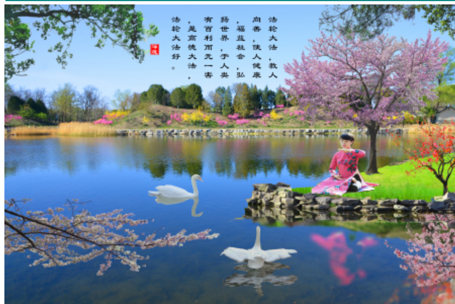
美术设计：法轮大法好 北京大法弟子