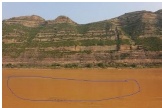
正常汛期黄河的样子(画线部分为正常黄色水样)

黄河水变清的区域当然是指的华北平原这块，而这片区域的黄河水变清也确有其事，在历史典籍中也有相应的记录。自古以来大家看到的黄河都是黄色的，因为水里的泥沙太多，民间还流传着“千年难见黄河清”的说法。所以黄河水变清这