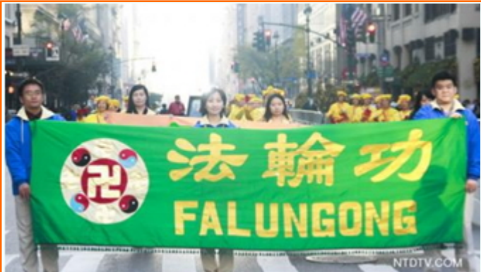
法轮功受邀参加纽约老兵节大游行