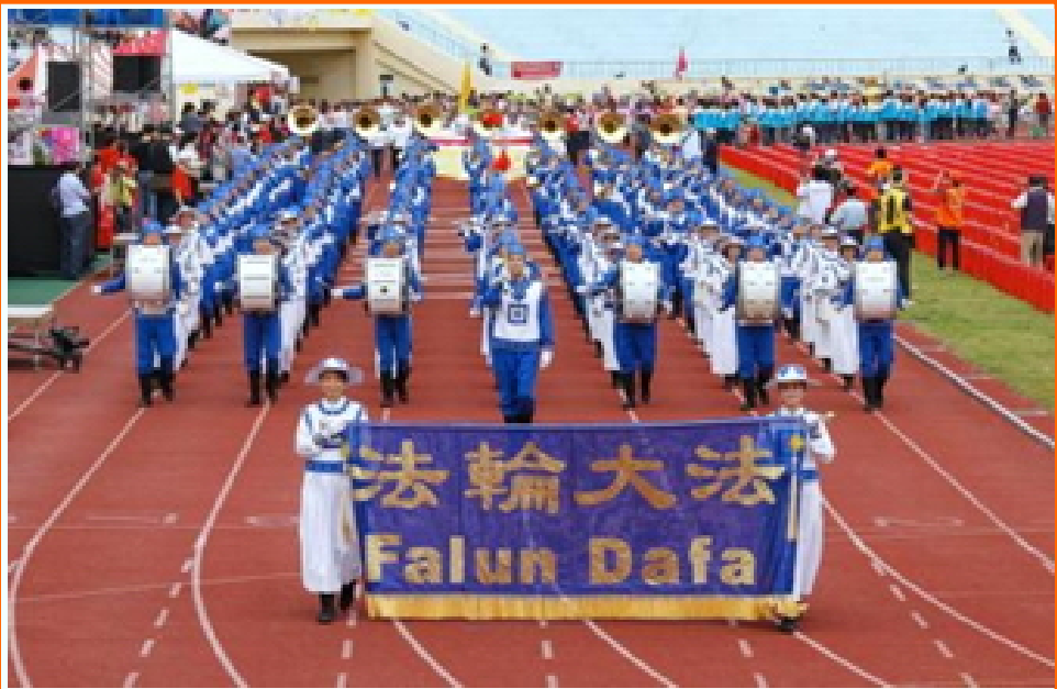
庆祝国际志工日 天国乐团震撼高雄