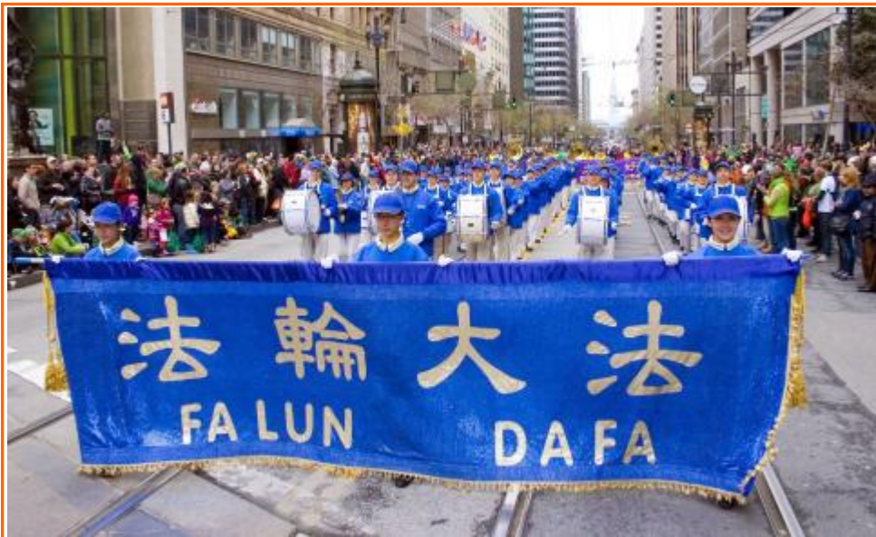
旧金山圣派翠克游行 法轮功受欢迎