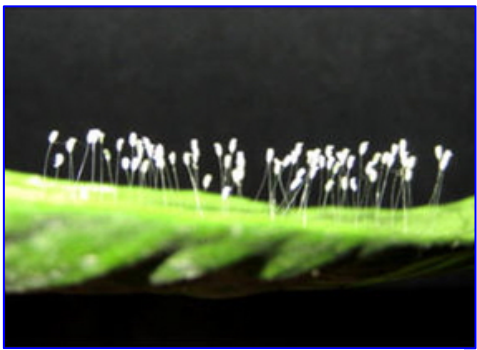
图为该法轮功学员家盛开的优昙婆罗花

2002 年在贵州省发现的五百年前滚裂的藏字石上写的“中国共产党亡”就是神示人的判决。天意不可违。中共邪党想依靠军队自保，那是白日做梦。西班牙流感，横扫千军如卷席，强大的古罗马帝国，被瘟疫肆虐而灭亡的历史，告诉人们，当天要灭中共邪党时，不费吹灰之力，一天就完事。而那些被中共邪党迷惑的人，就象《圣经》中讲的那样，将要承受中共邪党作恶而遭受的永无尽头的痛苦。所以，法轮功学员讲真相，劝三退，只是为了使你能避免成为中共邪党陪葬品的灭顶之灾。时间不等人，赶快加入退党退团退队的三退大潮，记住“法轮大法好”，才会遇难呈祥，逢凶化吉，进入美好的未来。