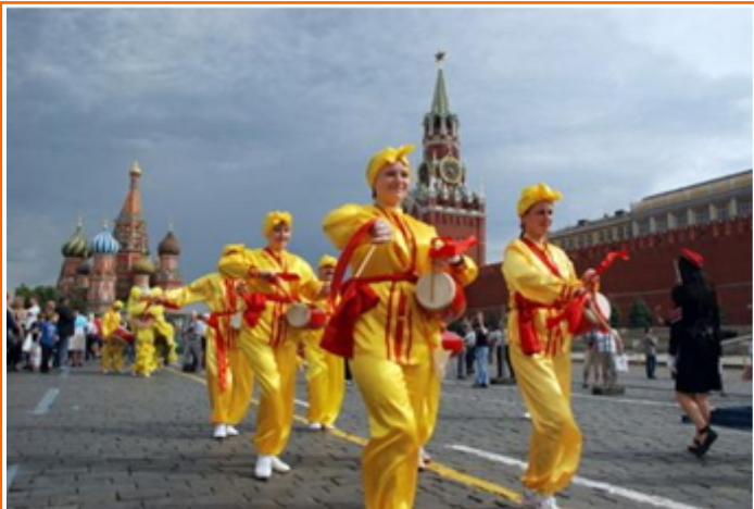
莫斯科法轮功学员在红场上展示功法