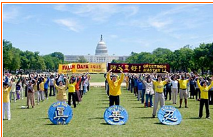
华盛顿 DC 法轮功学员庆祝世界法轮大法日